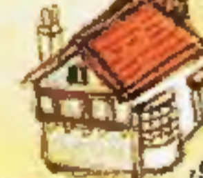
مخينة بريس بيلاك